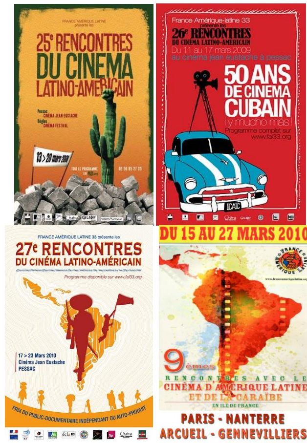
Ci-dessus : Affiches des Rencontres de cinéma latino-américain organisées par FAL Bordeaux et FAL Nationale

Fidèle à sa vocation culturelle, France-Amérique Latine s'attache à promouvoir la production audiovisuelle latino-américaine. Le comité local de FAL Bordeaux a créé un festival de cinéma dès 1982. Depuis 2001, le comité national organise également son propre festival en Île-de-France