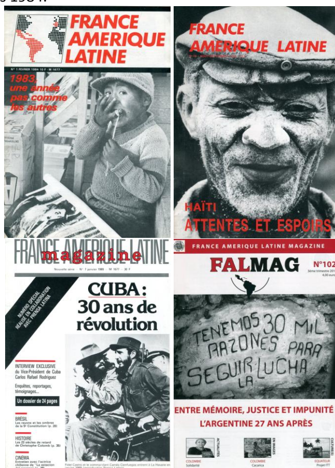
Ci-dessus : L'évolution de la revue ; n°1 (février 1984), n°19 (août-septembre 1986), n°7 – nouvelle série (janvier 1989), n°102 (3 ème trimestre 2010)

Pour exprimer notre solidarité, nous devons partir des réalités de terrain et des luttes collectives qui se livrent aussi bien en Amérique latine et Caraïbe qu'en Europe, en considérant non seulement « la politique au pouvoir », celle des gouvernements, mais aussi et surtout celle des mouvements sociaux, en mettant en avant les avancées démocratiques et les progrès sociaux, en faisant connaître la réalité des peuples de l'ALC qui se battent contre l'injustice et inventent des pratiques démocratiques originales. C'est le but de la revue Fal Mag depuis 1984.