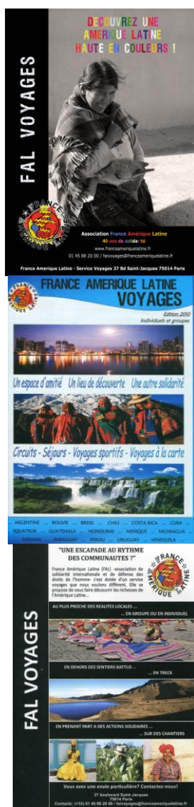
Ci-dessus : Brochures du service voyage de France-Amérique Latine

Le service voyages, que nous avons voulu différent, propose de découvrir les richesses naturelles, culturelles mais aussi humaines du continent latino-américain en accord avec les buts que poursuit notre association.