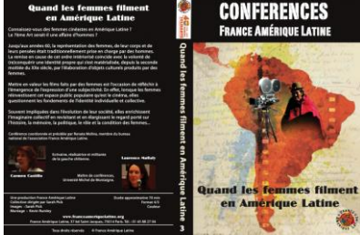
Ci-dessus : Jaquettes des trois premiers titres de la collection de DVD « Conférences » édités par France-Amérique Latine.