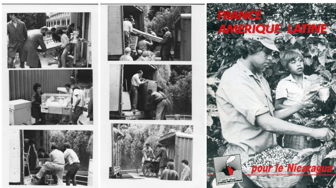
Ci-dessus : Photos montrant des militants de FAL lors du chargement du matériel médical dans les camions à destination du Havre dans le cadre de l'opération « Un bateau pour le Nicaragua » / Une du Fal Mag de février 1987.

En 1984, l'hôpital de Poitiers est reconstruit. Le matériel médical est alors proposé à un récupérateur. Informée par les syndicalistes de la CGT, FAL Poitiers porte son projet jusque devant le directeur de l'hôpital. Le matériel ainsi récupéré est transporté en camion jusqu'au Havre d'où doit partir le « Bateau de la solidarité avec le Nicaragua ». Le camion de 40 tonnes sera rempli grâce à la mobilisation des adhérents de FAL, de la CGT et d'autres associations comme Toit du Monde. Le maire de Poitiers viendra en personne assister au chargement. Au Havre, le bateau est chargé gratuitement par les dockers.